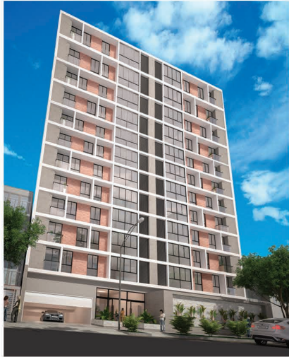
EDIFICIO SAENZ (2019 - Jesús María)