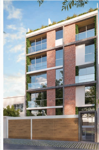
CASTILLA EXCELLENCE (2018 - Surco)