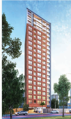
JARDINES DE URTEAGA (2019 - Jesús María)