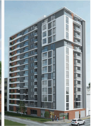
RESIDENCIAL GARZON (2017 - Jesús María)