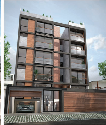
CASTELLANA SELECT (2018 - Surco)