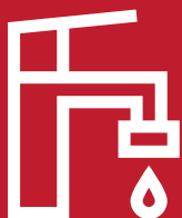
Grifería mono comando