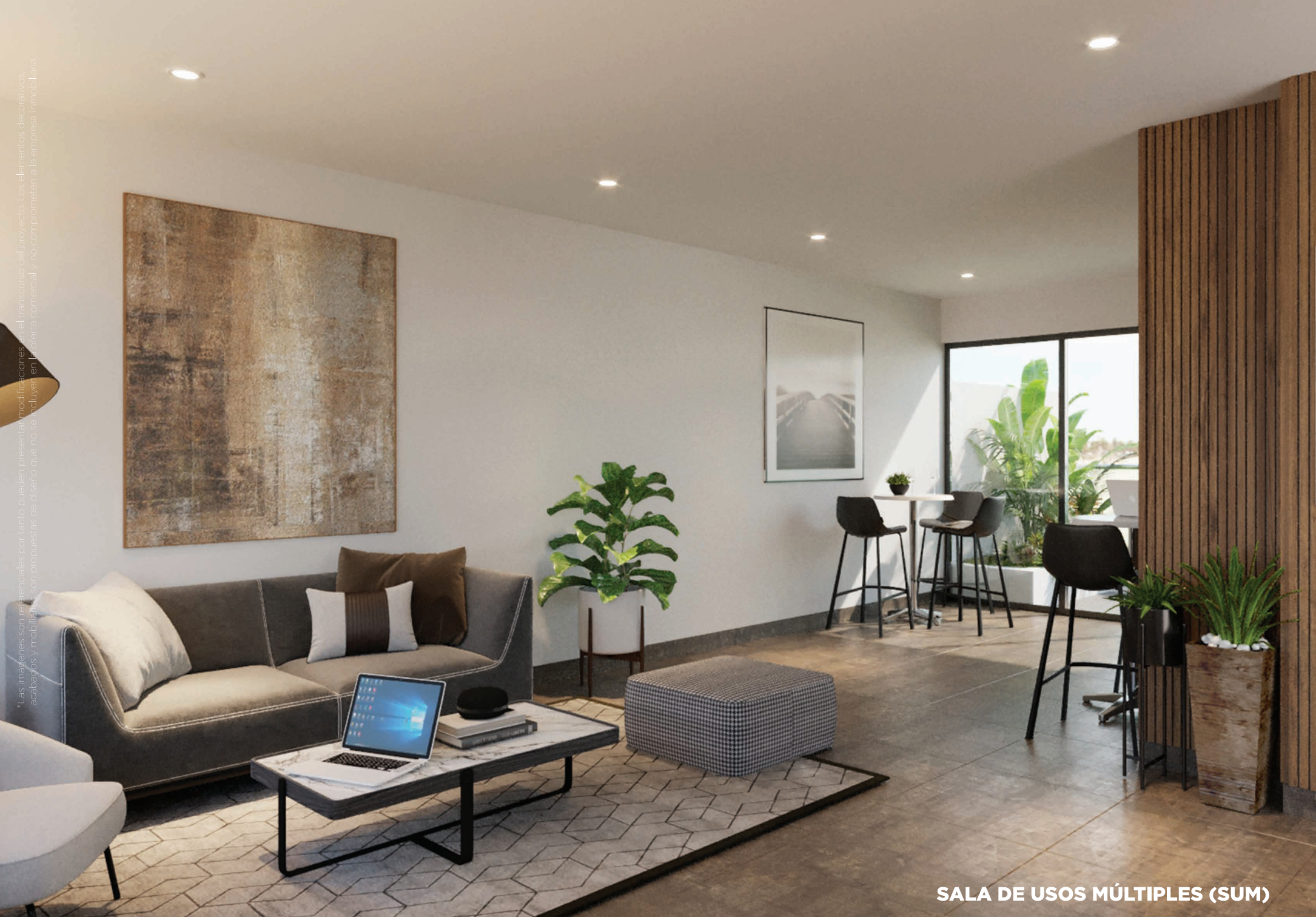
SALA DE USOS MÚLTIPLES (SUM)

*Las imágenes son referenciales por tanto pueden presentar modificaciones en el transcurso del proyecto. Los elementos decorativos, acabados y mobiliarios son propuestas de diseño que no se incluyen en la oferta comercial y no comprometen a la empresa inmobiliaria.