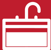
Mueble de baño